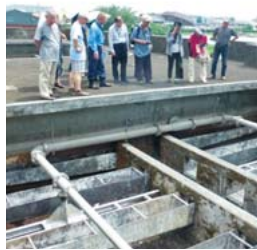
水を抜いたろ過池

対する判決が12月21日午後1時15分から横浜地裁502号室で開かれます。 裁判で次の2点を指摘 原告が存続を主張する理由は、ひとつには地盤の強固なところにある10万トンを超える豊富な地下水は災害時の川崎市民148万人の命の水だからです。ふたつ目は、企業団の導水管は2011年の地震の際に破