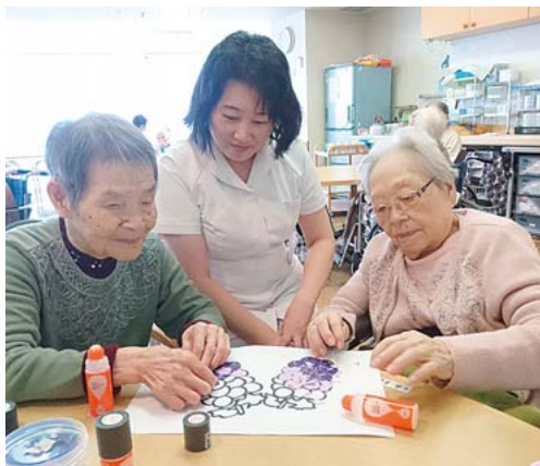
樹の丘の入所者さんとはり絵をしています。

た。新卒で入職したのは新宿の国立病院でした。楽しかった印象の整形外科を希望したのに、配属は神経内科と消化器内科の混合病棟。ALSなどの難病患者さんが多く、急患・急変対応、吸引、オムツ・体位交換の連続の三交代勤務にやや疲れ気味でした。