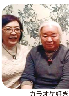
カラオケ好きのどんぐり班のみなさん