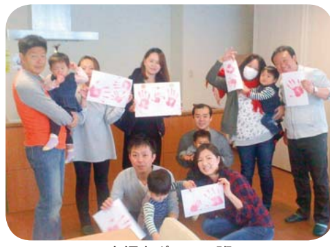
大師東ポニママ班

大師東支部の子育て班、「ポニママ」が子どもたちの2歳の記念に手形をとる班会を開きました。手形を子どもの成長の記念に残す家庭もあり、3人の手形が並びました。インクをあちこちに付けてしまわないか心配でしたが、思ったより皆さんうまくできました。最後にそれぞれ手形を持って記念撮影をしました。