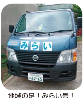
地域の足! みらい号!

「この団地はすごい高台にあつて、買い物するのも大変なところなんです。でも、7年ほど前から地域のみなさんの力でコミュニティバスが走るようになって、下のスーパーにお買い物に行けるようになったんです。コミュニティバスに感謝です」と、話します。コミュニティバスは月・金の9時から16時の間で1時間に2本程度、高台を下ったスーパーや郵便局を回っています。コミュニティバスの名前は「みらい」。地域で名前を募集してつけたそうです。高台に住む人の大事な足となっています。