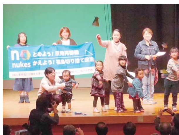
紙ひこうきに私たちの願いをのせて!