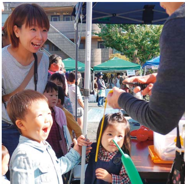
ワンちゃんをつくって！大人気バルーンアート

「健康まつり」は、川崎市内6カ所で開催しました。地域の公園や川崎医療生協の施設を会場として、血圧や体組成、骨密度、足指力などの健康チェックや健康相談を行いました。お祭りなので、焼きそばやフランクフルト、カレーライスの屋台も並びます。