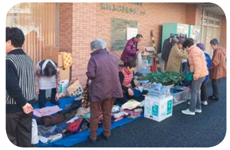
にぎわうふじさきクリニック前

11月12日、協同地域の保健委員でつくるさわやか健康づくり員会主催でバザーを開催しました。会場はふじさきクリニックの玄関横で、患者さんなどの来院者を中心に食器や衣類を販売しました。