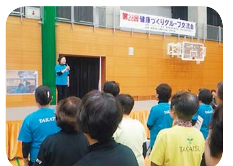
高津区健康づくり交流会

高津区の運動推進委員「ヘルスパートナー」が主催する企画「高津」が主眼です。初対面の緊張感もありますが、一緒に同じ体操をしている一体感が、子どもの時の運動会を思い出し、とても懐かしい心地良さを感じました。